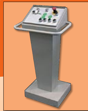
Export Control Desk