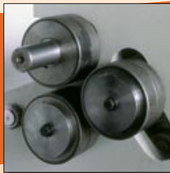
Angle rolls device